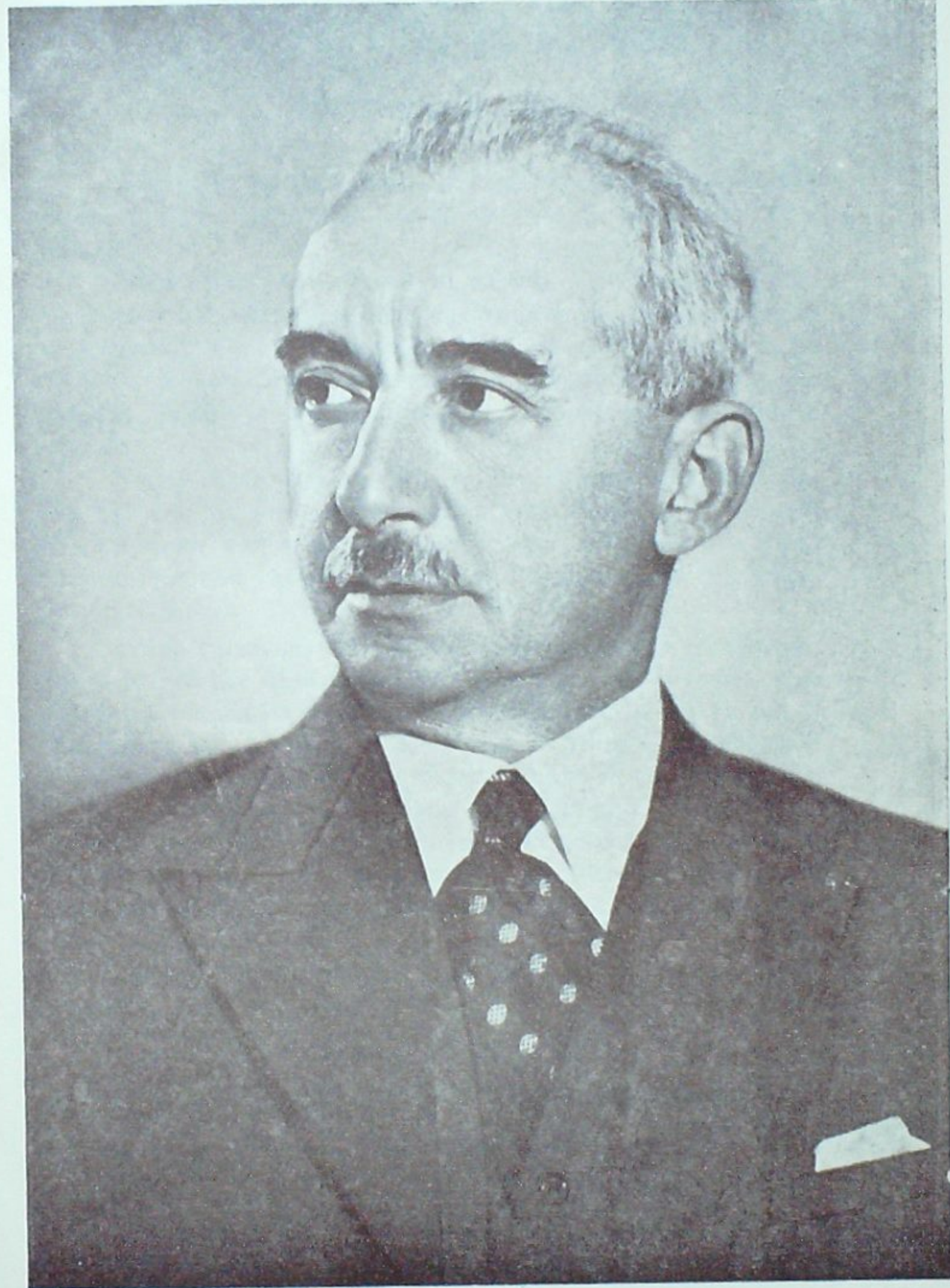
İkinci Cumhurreisimiz Millî Şef İSMET İNÖNÜ