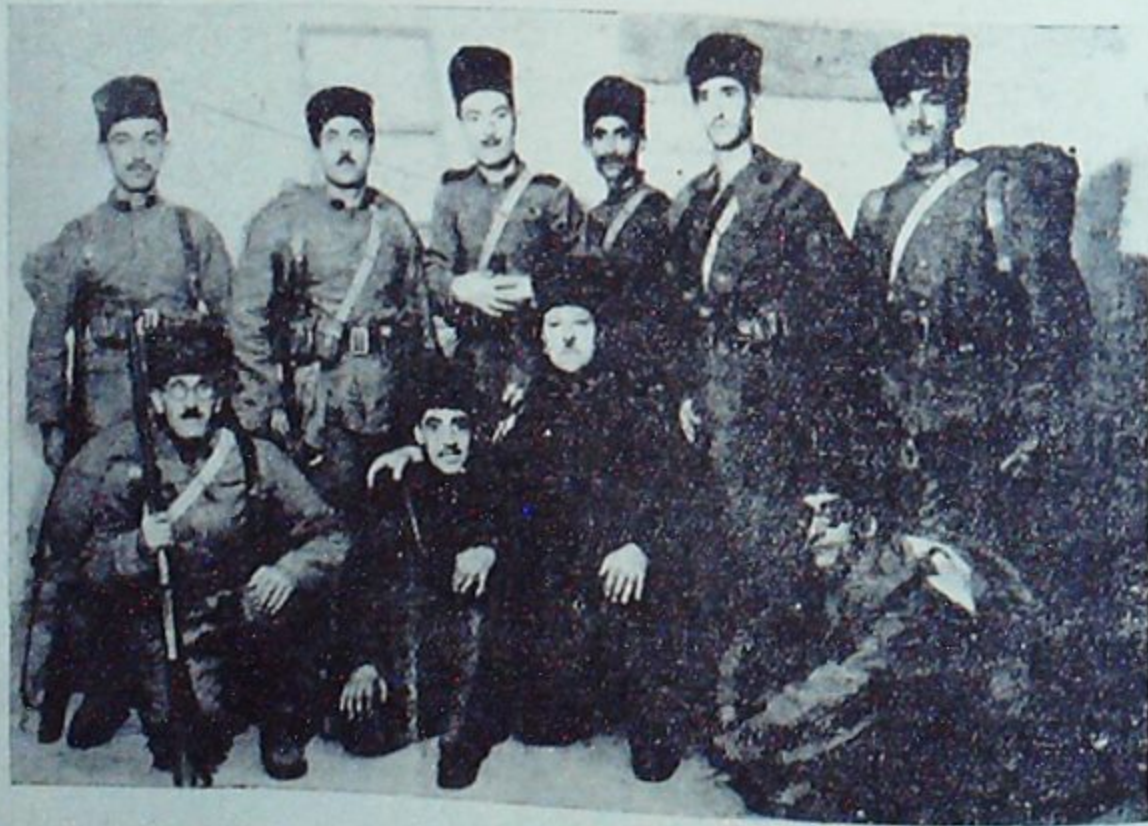
Sancağın Şerefi Temsilinde