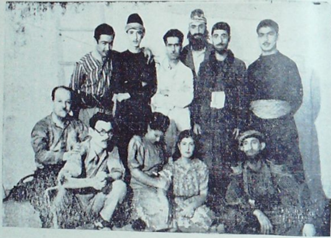
Uzun Mehmet Temsilinde