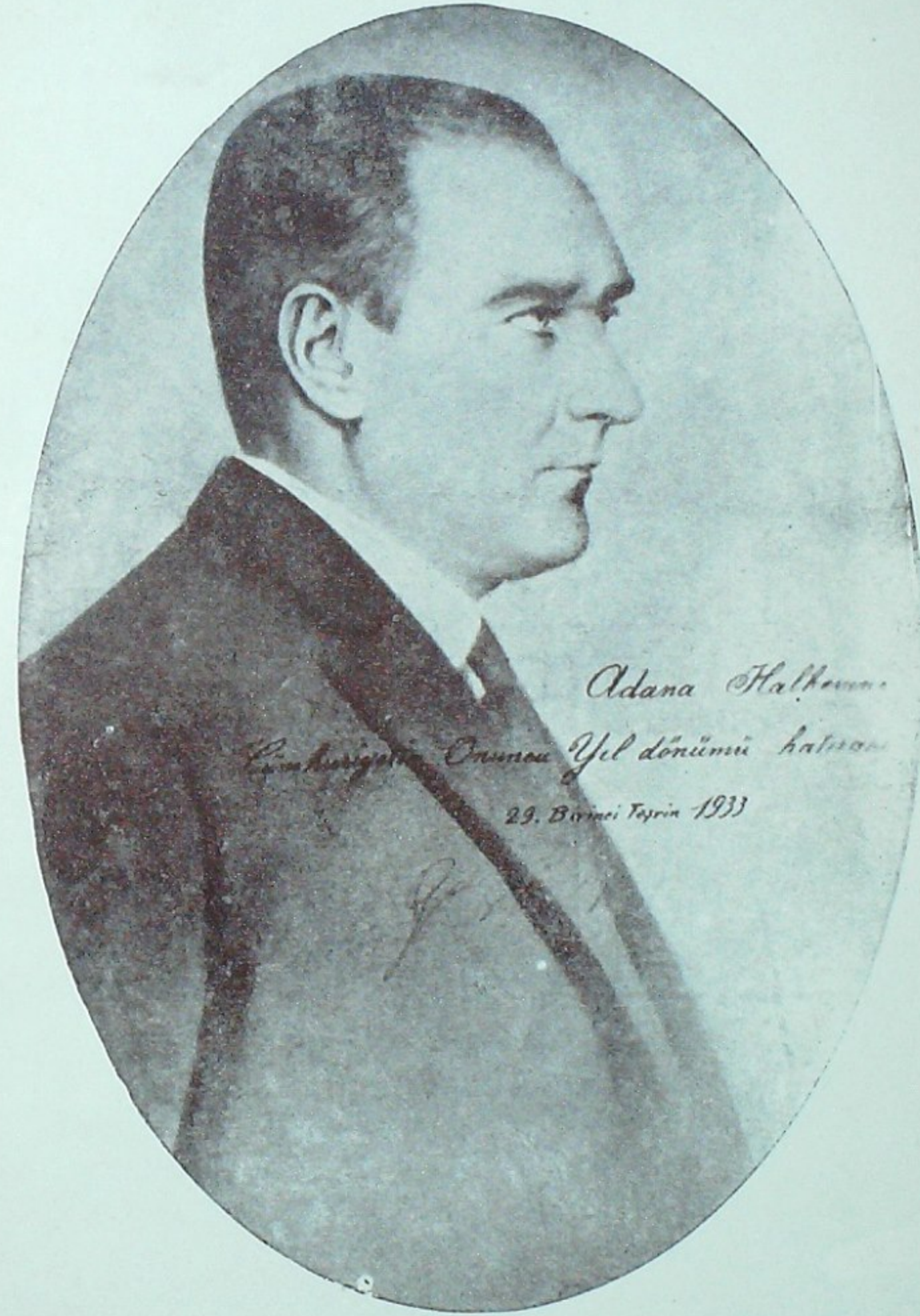
Cumhuriyetimizin Bânisi Ebedî Şef ATATÜRK