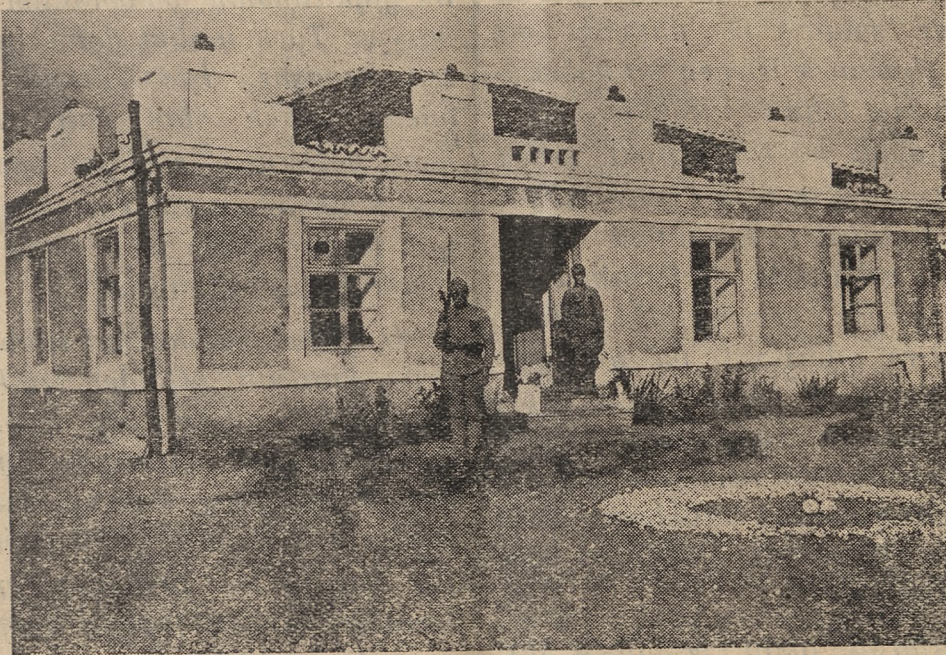
BATI SINIRINDA VATAN GÖZETLİYEN BİR KARAKOLUMUZ..

Türkün, muharip ve kavgacı bir millet olduğuna, demirden ve çelikten daha kuvvetli bir göğsü bulunduğuna bütün bir cihan inanmıştır. Türk, bu kahramanlık ışığını, bu ye-